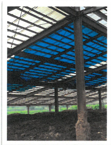
補修前 堆肥舎屋根