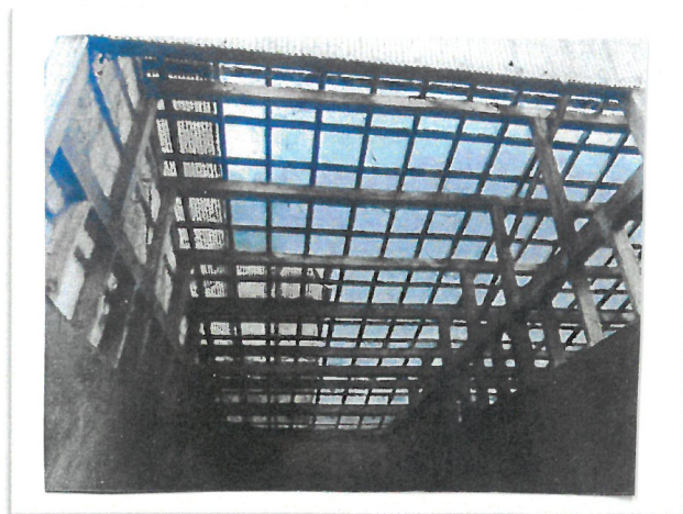
補修後 堆肥舎 屋根