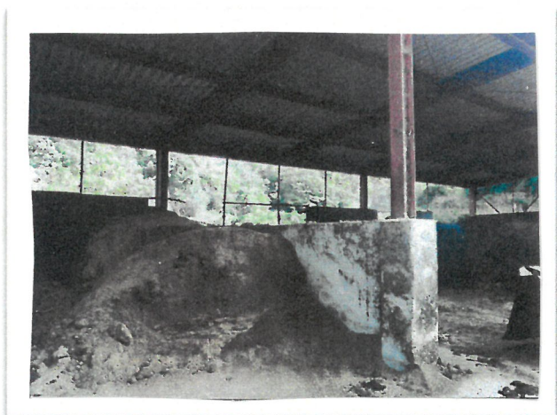
補修前 堆肥舎 壁