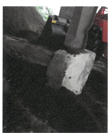
補修前 堆肥舎 柱