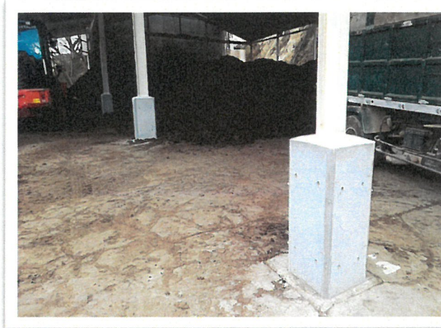
補修後 堆肥舎 柱