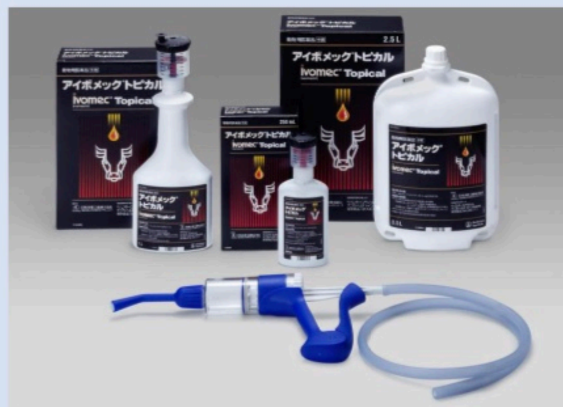
アイボメック®トピカル